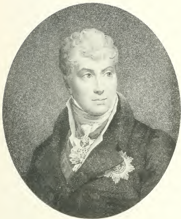
PRINCE DE METTERNICH